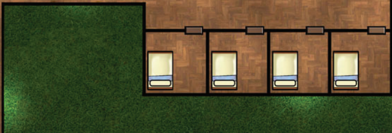
Taverna Dente do Lobo